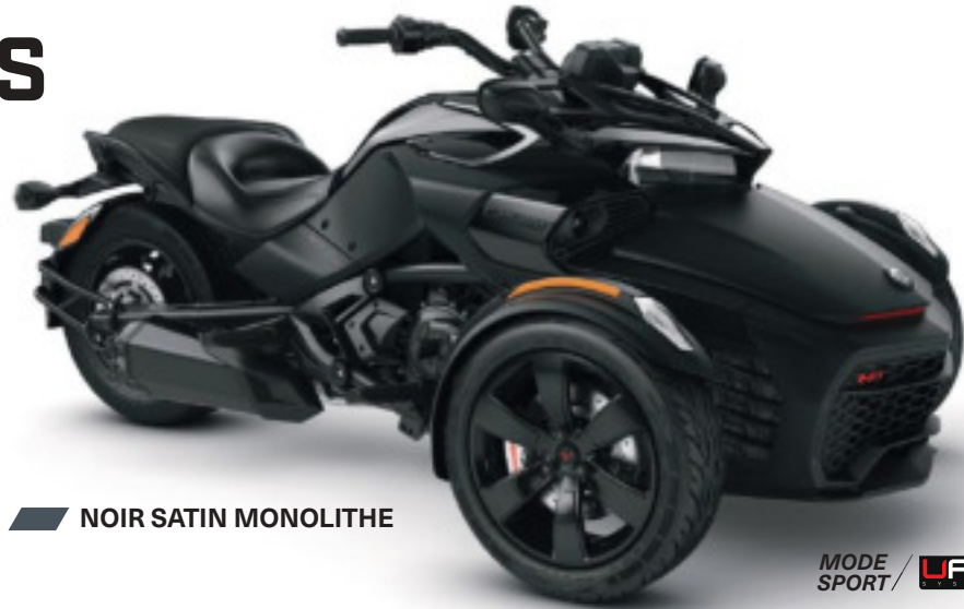
NOIR SATIN MONOLITHE