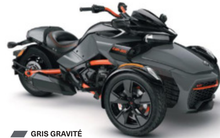
GRIS GRAVITÉ SÉRIE SPÉCIALE